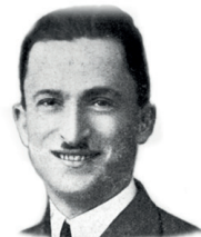
Reşat Nuri Güntekin